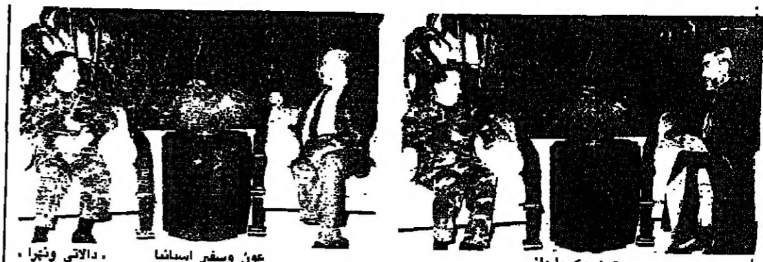
عون وسفير اسبانيا، دالتي ونبرا